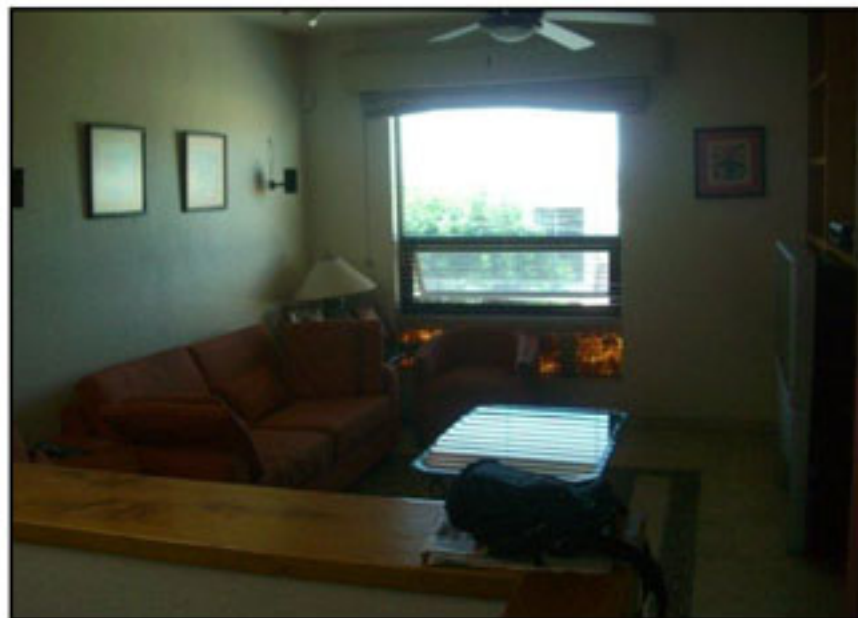
Estar de tv