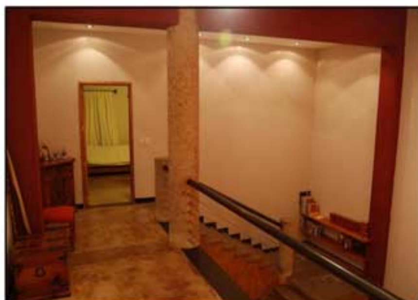
Distribuidor Planta alta