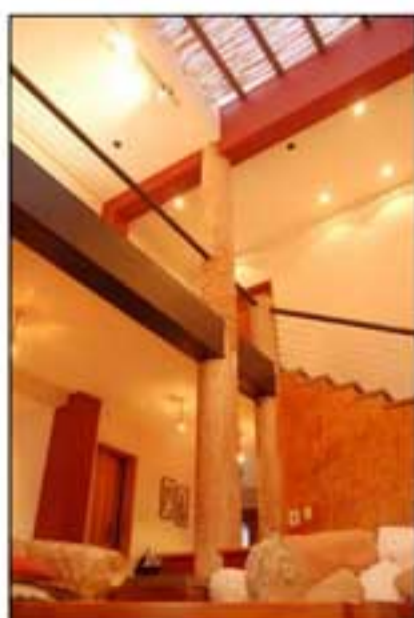
Vista Planta Alta