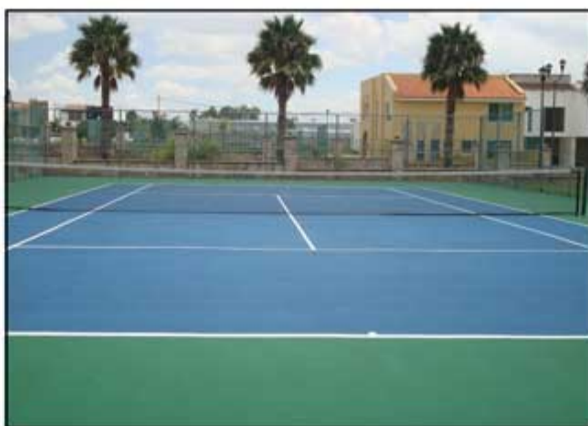
Cancha de tenis