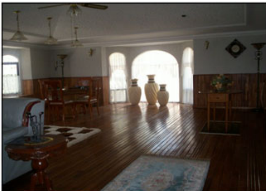
Salon de juegos